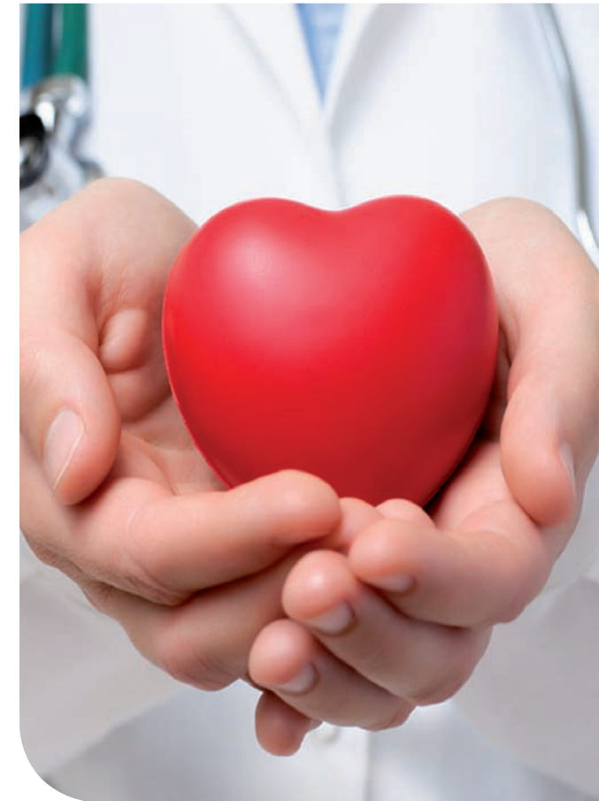
Titelbild: © Von Schonertagen / Fotolia